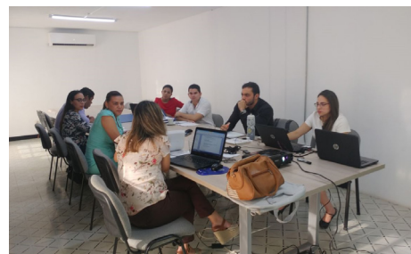
Foto: auditoria a los procesos de gestión docencia, proyección social, investigación y bienestar institucional.