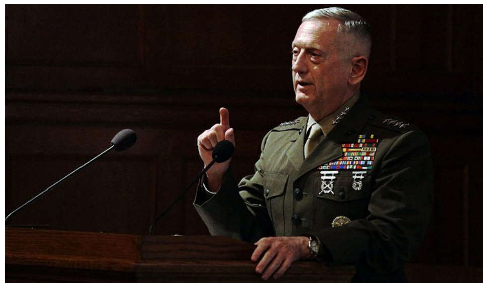
James Mattis, Secretario de defensa de Estados Unidos

Mattis continuó afirmando durante la rueda de prensa, "Tenemos numerosas opciones militares (...) Tenemos capacidad