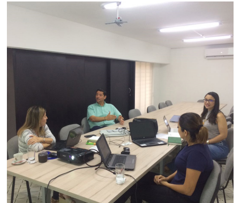
Foto: Auditoria a los procesos de dirección y mejoramiento continuo.

Finalmente, el Rector manifestó el compromiso de Corposucre por seguir fortaleciendo sus procesos, además indica que no es suficiente con tener un sistema que garantice buenos resultados; era necesario contar con una auditoría externa que asegure que se está cumpliendo con la labor, y este es el resultado hoy.