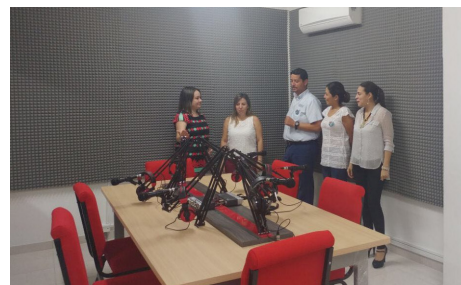
Foto: visita a laboratorios institucionales

implementar procesos de calidad en todas sus áreas. “Somos una institución joven, este año cumplimos el aniversario número 14, pero desde siempre nos hemos destacado por hacer las cosas bien; estamos muy orgullosos de todas las personas que hoy conforman nuestro equipo de trabajo, por su enorme responsabilidad y compromiso”. Puntualizó el Rector.