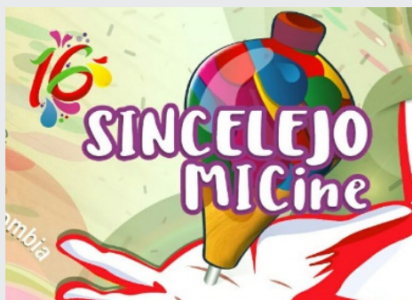
Imagen oficial de SINCELEJO MiCine 2017

Año a año, septiembre a septiembre, diferentes escenarios en Sincelajo son el epicentro de la proyección de películas no comerciales que llegan al público gratuitamente y que les enseña que hay cortos y largometrajes diferentes para ver y disfrutar de la imagen en movimiento.