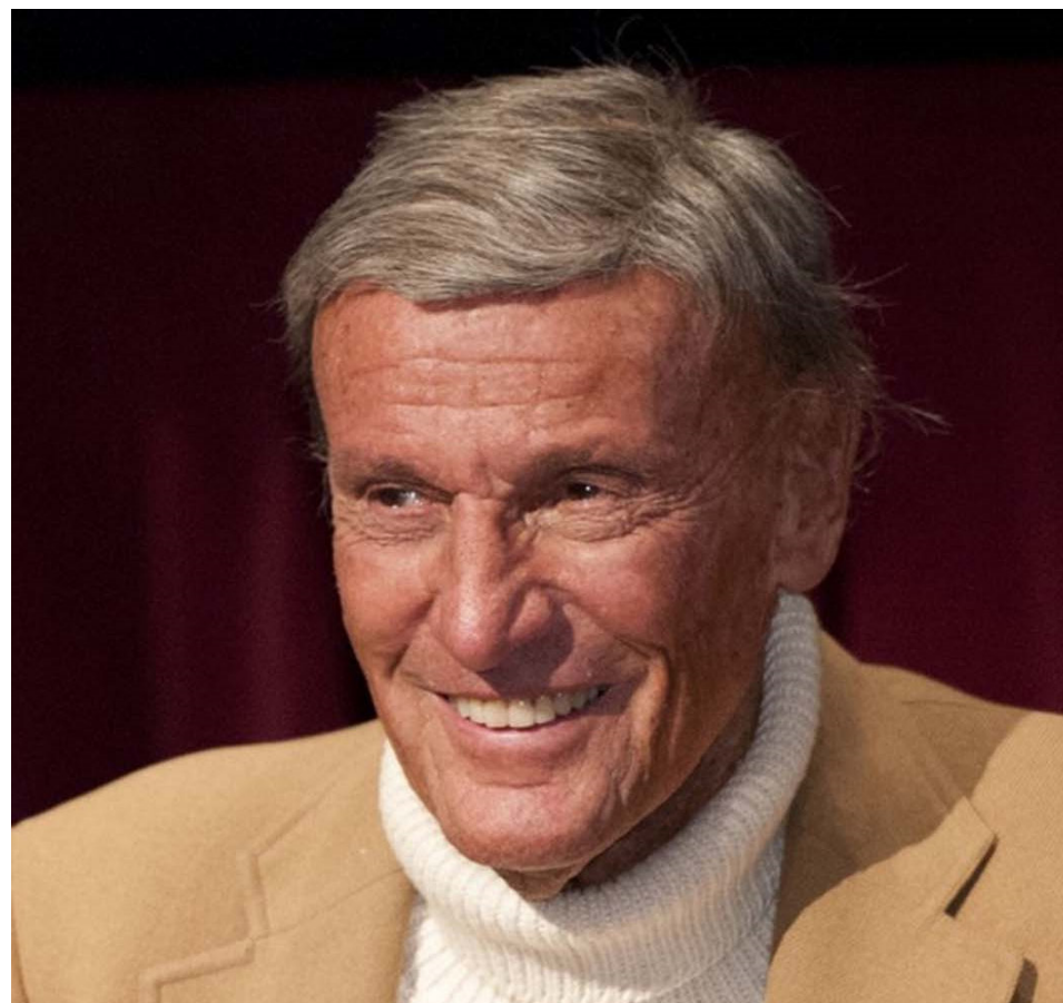
Richard Anderson, en 2012.

El actor estadounidense falleció el pasado 31 de agosto por causa de muerte natural a sus 91 años en Beverly Hills.