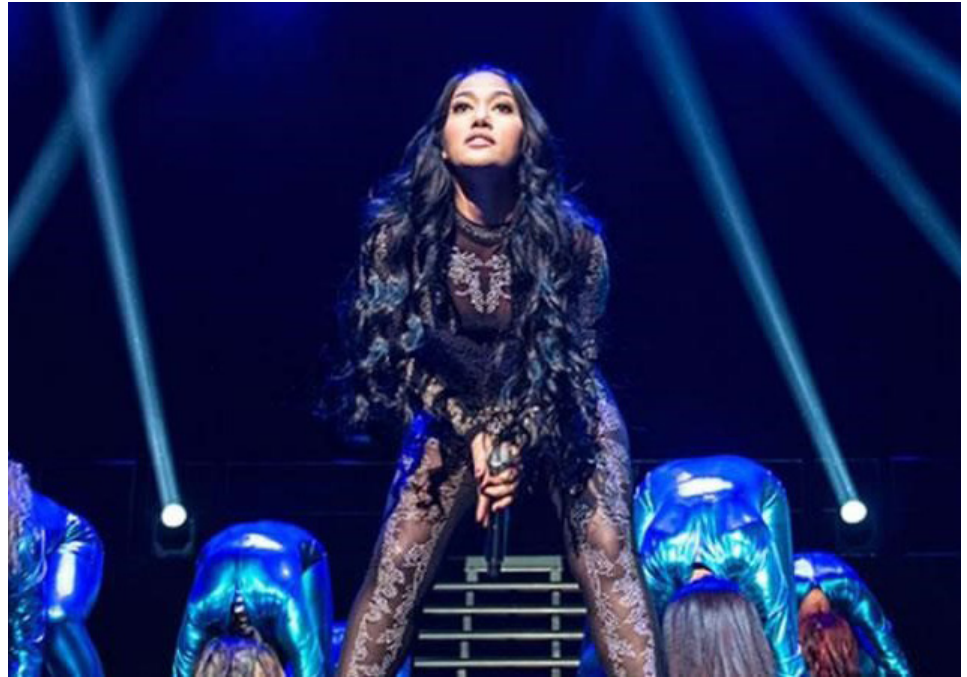
Farina interpretando 'portarme mal'.

Por su parte el samario Carlos Vives dio un gran show en su presentación en el magno evento, interpretó sus mejores éxitos y dio un gran espectáculo acompañado de artistas como Sebastián Yatra junto a quien cantó, "robarte un beso", y el grupo chochoano ChocQuibTown, con el que entonó "el mar de tus ojos"; el artista vallenato dejó en alto al país una vez más, pues se llevó una gaviota de oro a casa, también ganó una de plata pero está la obsequió a una de las personas que estaba en el público, añadiendo, "esto es para ti, y para mí", este gran gesto fue aplaudido y horas más tarde se viralizó por redes sociales.