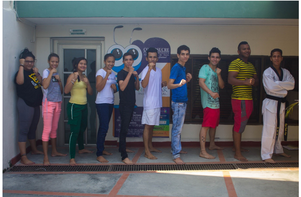
Estudiantes y profesor de taekwondo.