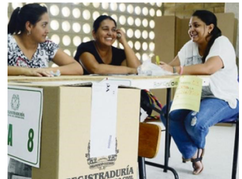
Jurados de votación.

Si te llegó un correo electrónico informando que habías sido seleccionado como jurado de votación por parte de CORPOSUCRE para las elecciones de este 11 de marzo, debes acercarte a la facultad en la cual tu programa de pregrado o posgrado se encuentra adscrita y solicitar la notificación que expide la registraduría nacional del estado civil.