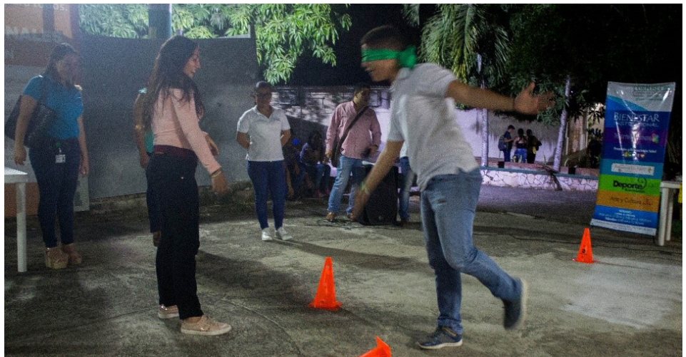
Estaciones del juego.