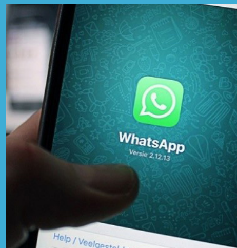
Imagen de la aplicación.

En el 2014, Mark Zuckerberg compró WhatsApp por una suma cercana a los 21.800 millones de dólares. Zuckerberg se dio cuenta que el mercado de las redes sociales está en los más jóvenes. Sin embargo, los adultos estaban ingresando a esta red social y eso los ahuyentaba de las demás. Sin duda, WhatsApp es una alternativa porque ofrece mayor privacidad. Y, además, porque en sus primeros cuatro años sumó más usuarios que el mismo Facebook. Entonces, era un peligro eminente para su permanencia.