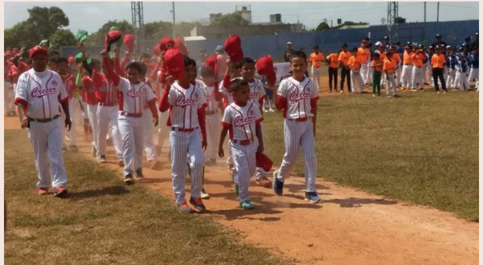
Apertura del torneo Pony béisbol en Sincelejo, en la foto el club Creceer

Un total de 12 clubes se dieron cita en la tan esperada apertura del torneo Pony beisbol el pasado sábado 24 de febrero en el estadio 20 de enero de la capital sucreña, las categorías que estarán participando son: preinfantil, infantil, prejunior, junior y libre, el campeonato irá hasta el mes de junio de 2018.