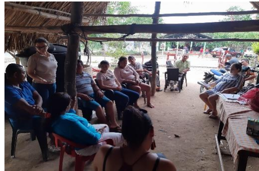
Aplicación de grupo focal