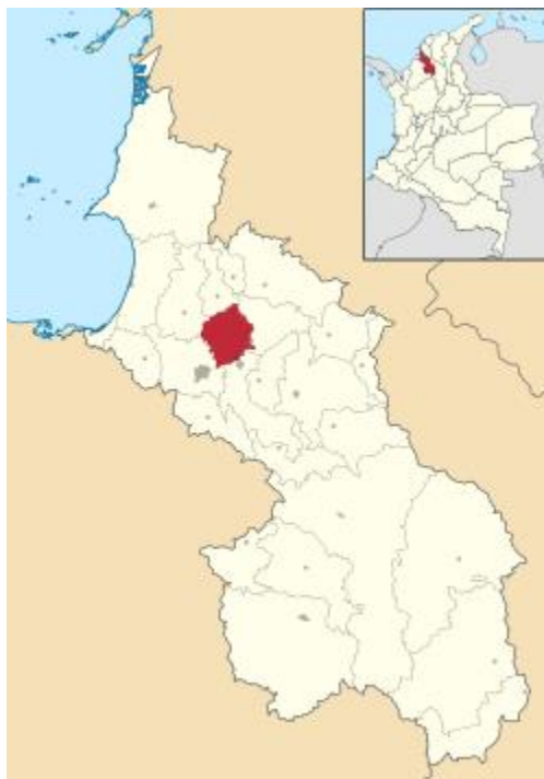
Figura 1. Localización del Departamento de Sucre