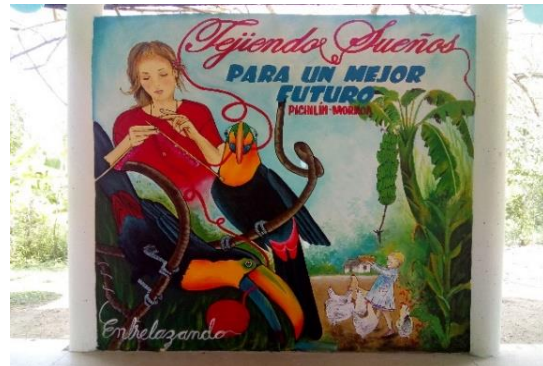
Cierre de la Estrategia Entrelazando