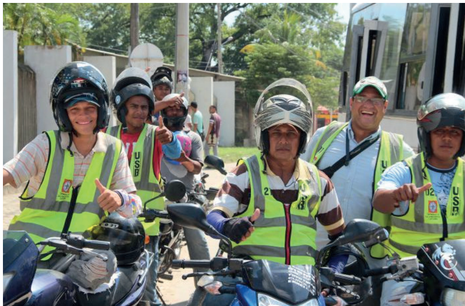
El oficio del mototaxismo cada día crece en Sincelejo.

Los ingresos mensuales de un mototaxi que van desde un millón doscientos, hasta un millón setecientos mil pesos, dependiendo la cantidad de tiempo y esfuerzo que em-