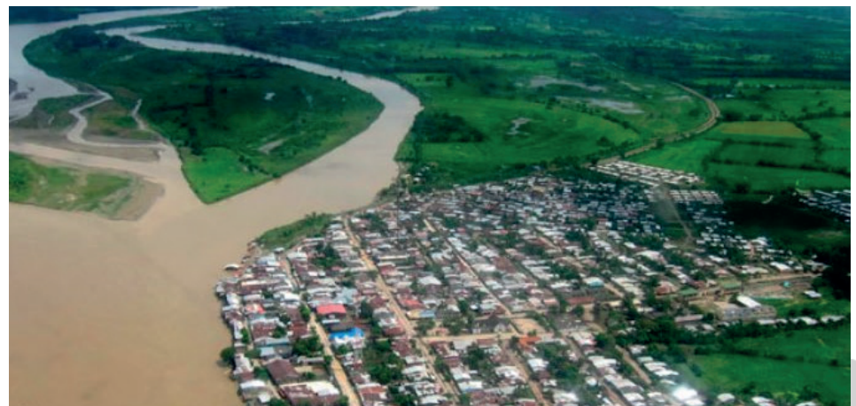
Los habitantes de la Mojana son beneficiados por el proyecto que gestiona PNUD y el Ministerio de ambiente, con la intención de promover en las subregiones, la adaptación del cambio en el clima.