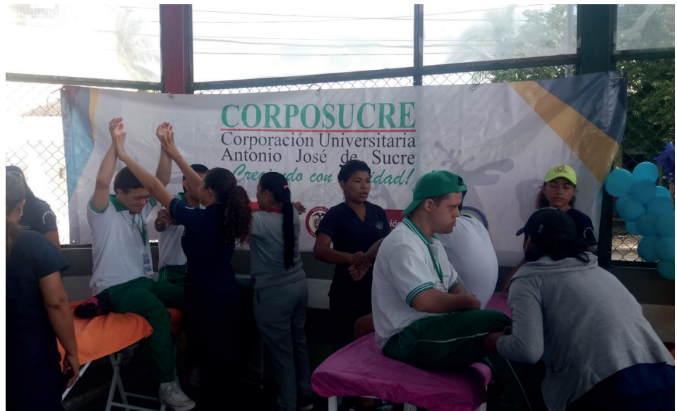
Corposucre tuvo una participación activa en las V Olimpiadas Especiales de Sincelejo, organizadas por el IMDER municipal, con la colaboración de 120 estudiantes del programa de Fisioterapia de 1°, 2°, 4°, 5°, 6° y 7° semestre, que por primera vez estuvieron presentes en esta actividad.

El contacto con los niños, experimentar cómo se realizan las olimpiadas, fue una de las mejores experiencias para los estudiantes, quienes sirvieron como acompañantes, abrazadores, guías para niños con discapacidad visual y auditiva. Para el próximo año, Corposucre, sería una de las instituciones que el IMDER tendría en cuenta para la organización de las Olimpiadas Especiales.