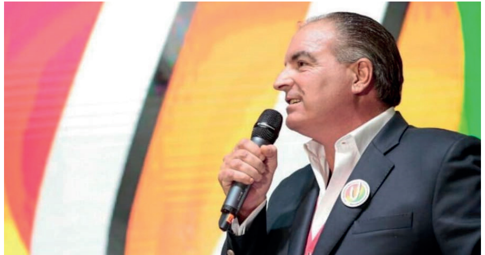
Todo estuvo listo para lo que fue la convención nacional del partido de la U.

Por su parte el máximo dirigente político y fundador del Partido de la U, Juan Manuel Santos Calderón durante su intervención hizo un llamado a los militantes de la colectividad a defender los acuerdos de paz firmado entre el gobierno nacional y la