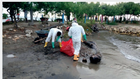
Trabajos de Recolección de Crudo en el Golfo de Morrosquillo

Afirmaron que aún no les han cumplido con las ayudas por el derrame de 2015 y ahora se presenta otro vertimiento que los perjudica nuevamente.