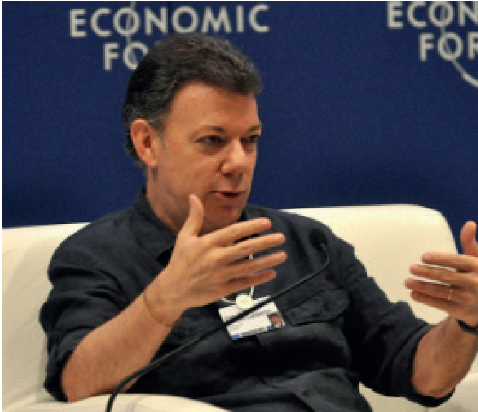
Juan Manuel Santos a la espera de recibir este premio.

El mandatario colombiano recibirá distinción en Reino Unido este 11 de noviembre, gracias al trabajo que viene realizando en pro de la biodiversidad desde su mandato, así lo da a conocer el comité de la real Jardín Botánico de Kew (The Royal Botanic Gardens Kew) en el periódico el Tiempo donde afirma que “gracias a los acuerdos de paz y al compromiso por la fauna y flora a través del programa Colombia Bio, muchas personas pudieron visitar aquellos lugares que por culpa del conflicto pocos conocían”. En la noticia que reveló el periódico se constata que Juan Manuel Santos será el primer presidente en recibir tal reconocimiento, teniendo en cuenta que el Ministerio de Ambiente y el sector de Ciencia y Tecnología tuvieron un recorte total del 19% como pérdida en su gobierno.