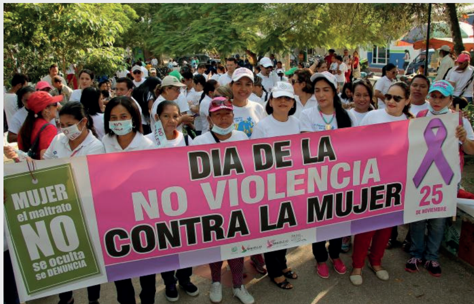
Se espera masiva participación del género femenino, en la jornada que será institucionalizada el próximo mes de noviembre por parte de la alcaldía.