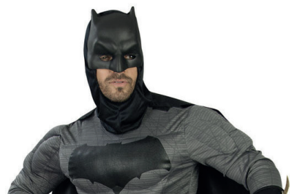
Disfraz de Batman

Más que por tradición, en Colombia cada año son en mayor número, los adultos que adquieren disfraces para usar el 31 de octubre, fecha en la que se celebra la noche de Halloween.