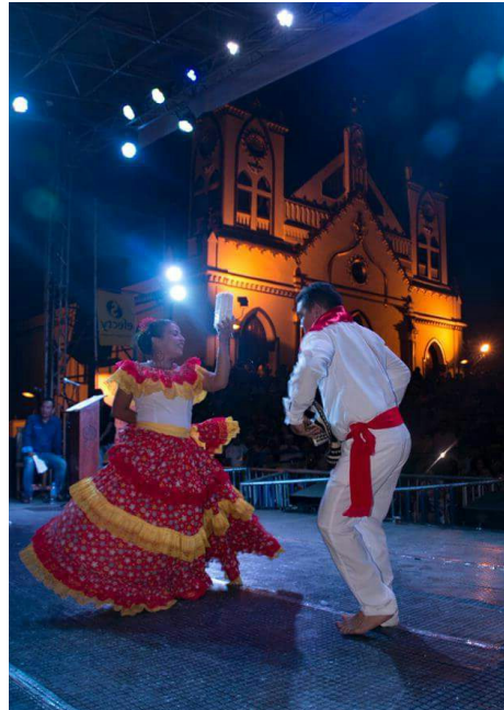
Pareja ganadora

"Bueno, recuerdo que mis inicios en la danza se dieron cuando tenía tres años y medio, cuando estudiaba en una institución que siempre ha estado forjando la cultura como lo es la Fundación Hijos de la Sierra Flor. Cuando inicié entré a un hogar infantil y como ellos estaban trabajando mucho eso, me incliné por la parte artística, estimulación corporal sobre todo. Y desde ahí quise explorar mis dotes de manera empírica en el baile.