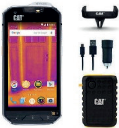
CAT S60 y accesorios.

Se trata de la creación del celular más resistente de los últimos tiempos, se puede decir que es el todo terreno de los celulares de la actualidad. Este recibe el nombre de CAT S60, que aunque no sea el celular más fino, delgado y elegante, si cuenta con la facultad de soportar situaciones extremas como resistir una caída desde una altura de 1.8 metros o ser sumergido hasta una profundidad de 5 metros y aguantar en esta condición durante una hora, son esta algunas de las características principales del CAT S60.