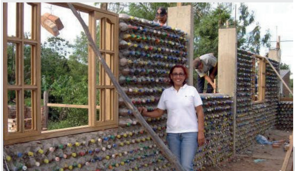
Casa en construcción con Ecoladrillos.

Con patentar el invento apenas es el primer paso para estos investigadores colombianos, ya que los retos que vienen son grandes en cuanto a nuevos resultados arrojados con las pruebas constantes al invento todo esto con el fin de mejorarlo y conocer más de sus capacidades para elaborar los ladrillos ecológicos.