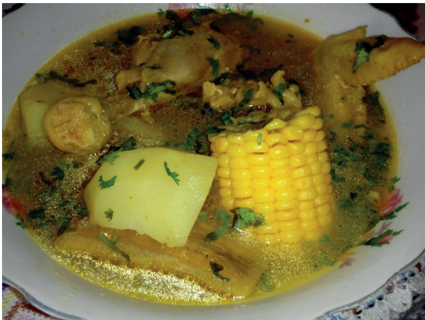
Este es uno de los platos típicos que identifican la cocina sucreña.

Según los conocedores de la cocina sincelejana existen diversos platos típicos que representan la culinaria sabanera, uno de estos es el mote de queso preparado de una manera auténtica con ñame, queso, suero y el famoso hogao (un sofrito de cebolla, tomate y ajo) el cual le da un rico sabor.